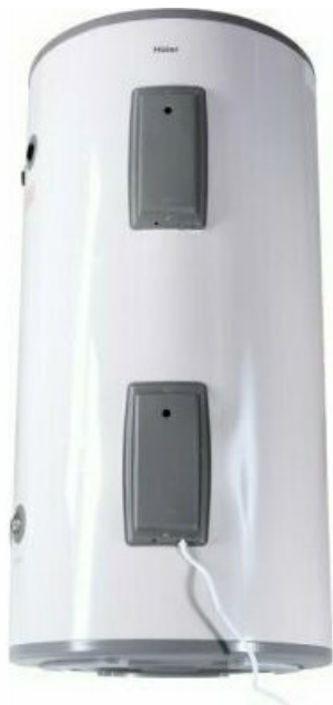
Фото Электрический накопительный водонагреватель HAIER FCD-JTLD200

Тел: +7 495 212-12-64 | Email: sale@ha-russia.com | https://ha-russia.com