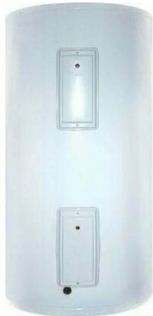
Фото Электрический накопительный водонагреватель HAIER FCD-JTLD300

Тел: +7 495 212-12-64 | Email: sale@ha-russia.com | https://ha-russia.com