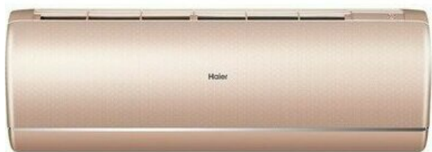
Фото Настенный внутренний блок мульти-сплит системы HAIER AS25S2SJ2FA-G

Тел: +7 495 212-12-64 | Email: sale@ha-russia.com | https://ha-russia.com