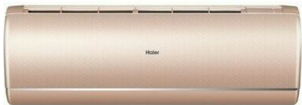
Фото Настенный внутренний блок мульти-сплит системы HAIER AS50S2SJ2FA-G

Тел: +7 495 212-12-64 | Email: sale@ha-russia.com | https://ha-russia.com