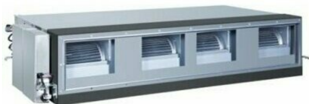
Фото Канальная VRF система HAIER AD962MHERA

Тел: +7 495 212-12-64 | Email: sale@ha-russia.com | https://ha-russia.com