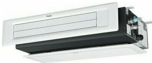
Фото Канальная VRF система HAIER AD182MSERA(H)

Тел: +7 495 212-12-64 | Email: sale@ha-russia.com | https://ha-russia.com