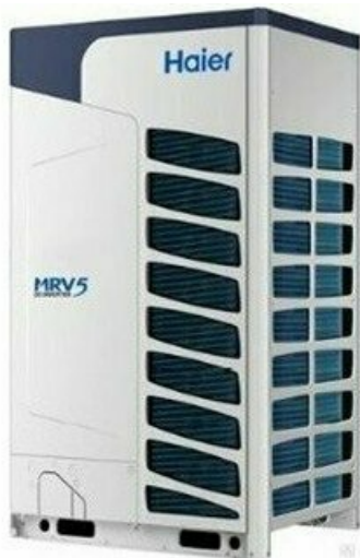
Фото Наружный блок VRF системы HAIER AV26NMVETA

Тел: +7 495 212-12-64 | Email: sale@ha-russia.com | https://ha-russia.com