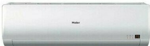
Фото Настенная VRF система HAIER AS122MNERA

Тел: +7 495 212-12-64 | Email: sale@ha-russia.com | https://ha-russia.com