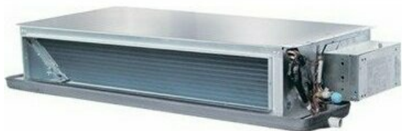
Фото Канальный кондиционер HAIER AD50S1LS1FA/1U50S1LM1FA

Тел: +7 495 212-12-64 | Email: sale@ha-russia.com | https://ha-russia.com