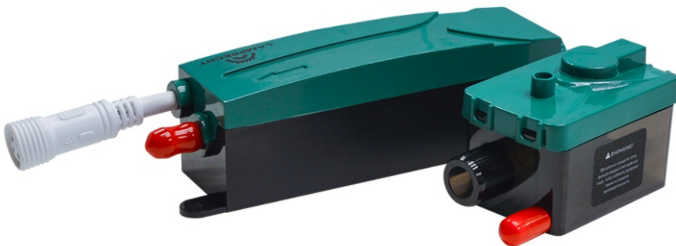
Фото Насос Дренажный Lamprecht Green Mini Flow LP015-15FL

Отправьте запрос на коммерческое предложение и получите индивидуальные цены и сроки поставки